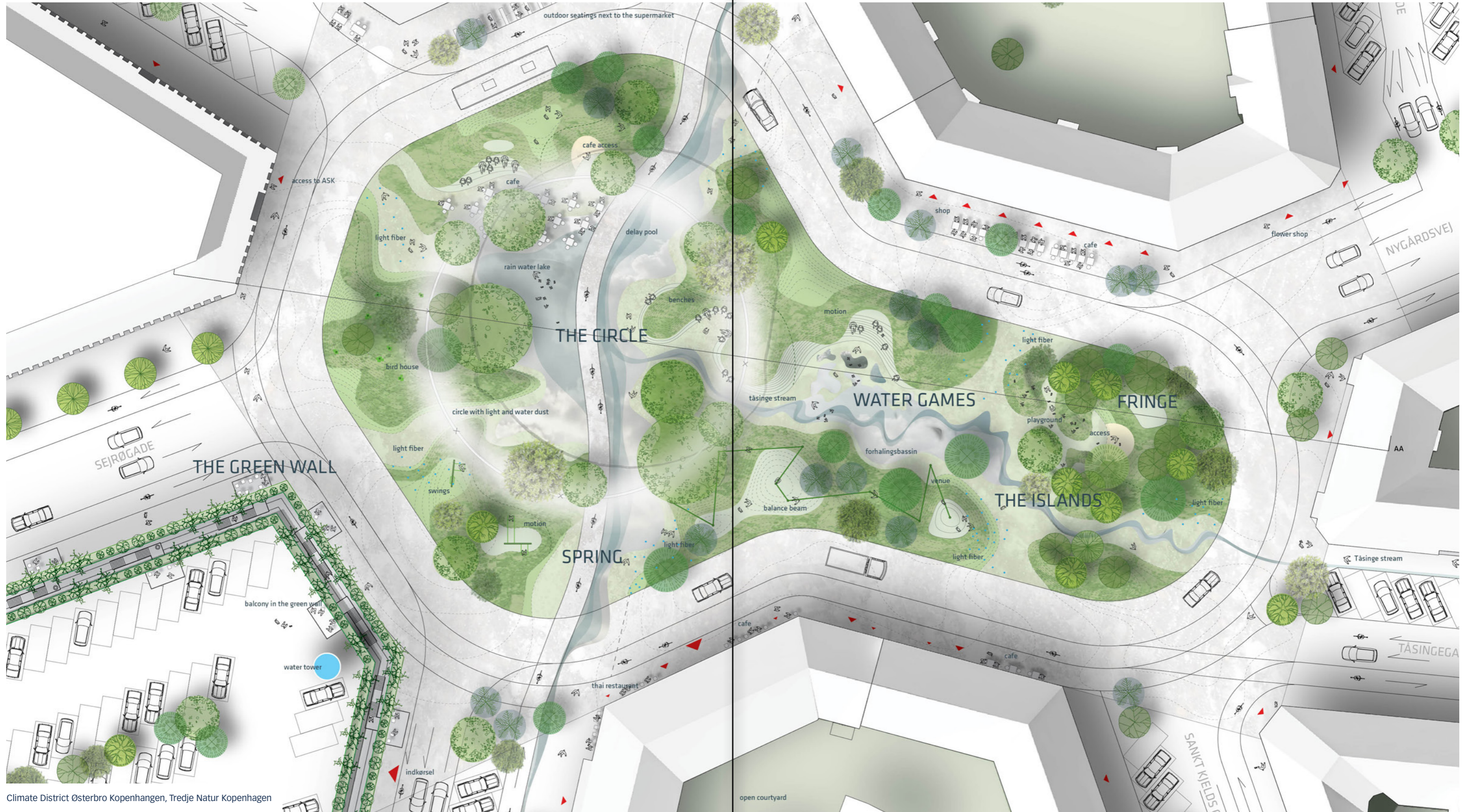
Climate District Østerbro Kopenhagen, Tredje Natur Kopenhagen