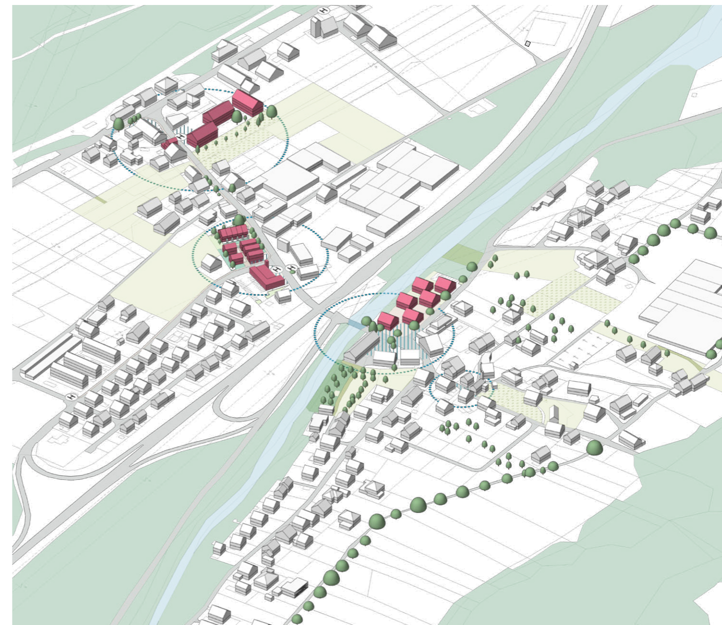
Quartiersentwicklung SBBR Stallehr-Bludenz-Bings-Radin