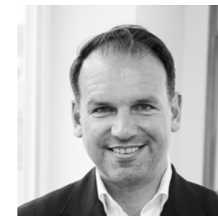
Dipl.-Ing. Gustav Spener Präsident der Ziviltechnikerkammer für Steiermark und Kärnten

Als Ziviltechniker:innen tragen wir große Verantwortung für die Gestaltung unseres Lebensraumes. In komplexen Querschnittsmaterien wie Quartiersentwicklung, Raumplanung oder Umweltschutz sind wir als Expert:innen unterschiedlichster Fachrichtungen stets bestrebt, interdisziplinär und unabhängig qualitätsvolle Lösungen zu finden. Die Herausforderungen durch die Klimaerwärmung werden wir jedoch nur alle gemeinschaftlich, als Gesellschaft, bewältigen können. Mit der Herausgabe dieses Booklets, möchten wir Wege aufzeigen, urbane und ländliche Quartiere klimafit zu gestalten.