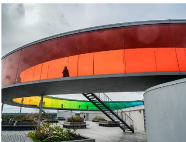
ARoS Kunstmuseum, Schmidt Hammer Lassen, 2004 / Your Rainbow Panorama, Olafur Eliasson, 2011

Informationen zu Veranstaltung und Teilnahme finden Sie hier .