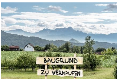
Foto: Johann Jaritz, Wikimedia Commons, lizenziert unter CC BY-SA 4.0; Collage: Christina Kirchmair