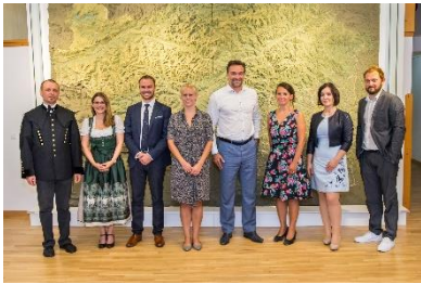
Steiermark am 1.8.2017