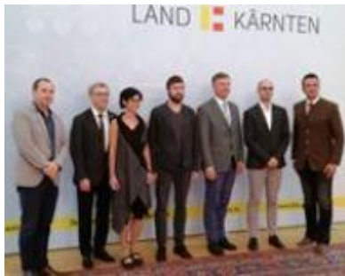
Kärnten am 24.7.2017