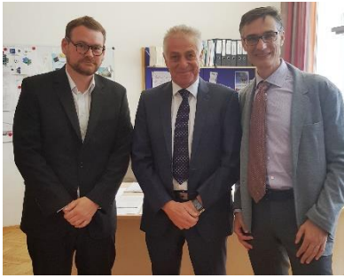
Steiermark am 27.7.2017