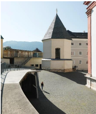
Aussenanlagen Ost